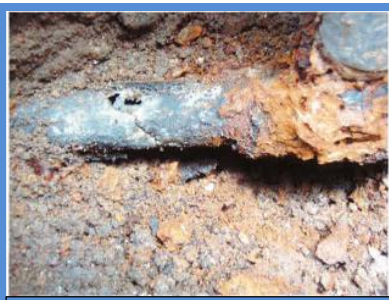
○埋設年数 : 41年 ○所在地 : 東京都