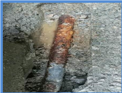
○埋設年数 : 40年 ○所在地 : 徳島県