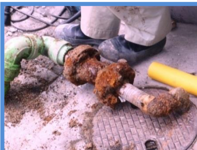
○埋設年数 : 50年 ○所在地 : 広島県