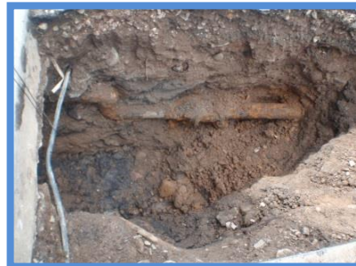
○埋設年数 : 38年 ○所在地 : 北海道