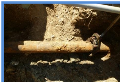
○埋設年数 : 40年 ○所在地 : 香川県