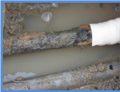
○埋設年数 : 45年 ○所在地 : 三重県