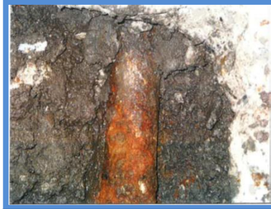
○埋設年数 : 43年 ○所在地 : 東京都