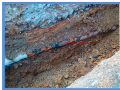
○埋設年数 : 41年 ○所在地 : 大阪府